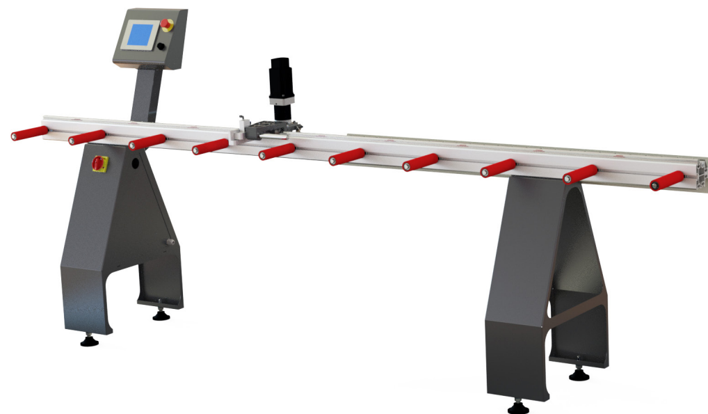
CALIBRADOR BLUETOOTH (opcional)